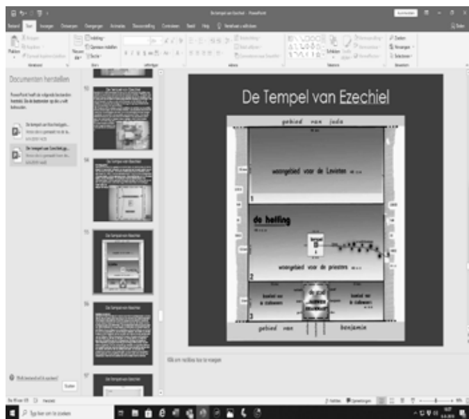
Fig.2 De 'heilige Heffing', bestaat uit 3 stroken voor resp. Levieten, Priesters en de stad, en meet 25000 x 25000 el (ca. 12,5 x 12,5 km).

Vanuit het buitengebied betreden we dit Tempelgebied door de noord- of zuidpoort d.m.v. 7 treden. Vanuit de buiten-voorhof gaan we via 8 treden op naar de binnen-voorhof, met het centraal gelegen brandofferaltaar. Tenslotte betreden we door 10 treden het Tempel terras met de Tempel zelf en het 'Heilige der Heiligen'. De treden zijn 0,6 el hoog (ca. 30 cm). Dat is nogal veel (normaal ca. 20 cm), maar bij monumentale gebouwen met een ceremonieel doel komt dat vaker voor. Men passeert altijd de poortgebouwen (N. en/of Z.) met zijn poortwachters. Kennelijk gaat men op naar niveaus van toenemende heiligheid.