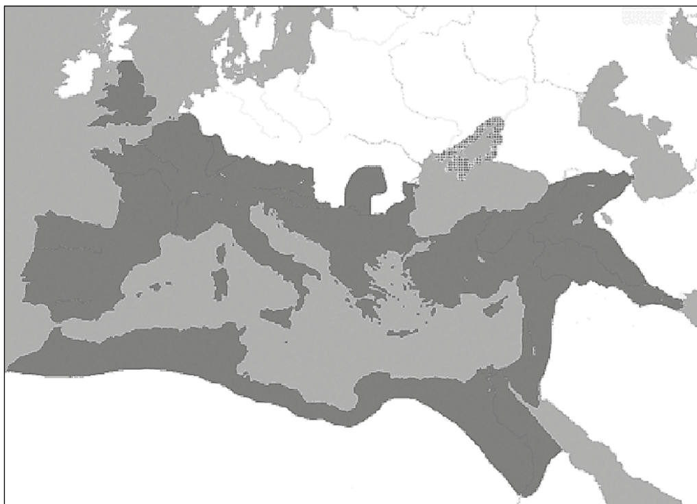
De omvang van het Romeinse rijk onder keizer Trajanus (98-117)

geregeerde, Romeinse rijk moeten denken. Op Rome (en niet op Byzantium) wijzen namelijk de 'zeven bergen' en 'de grote stad die het koningschap heeft over de koningen van de aarde' in Openb.17:9,18.